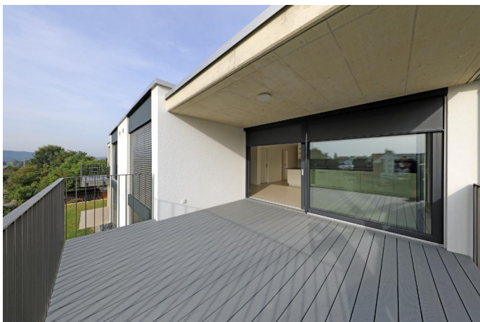
Teilweise überdeckter Balkon