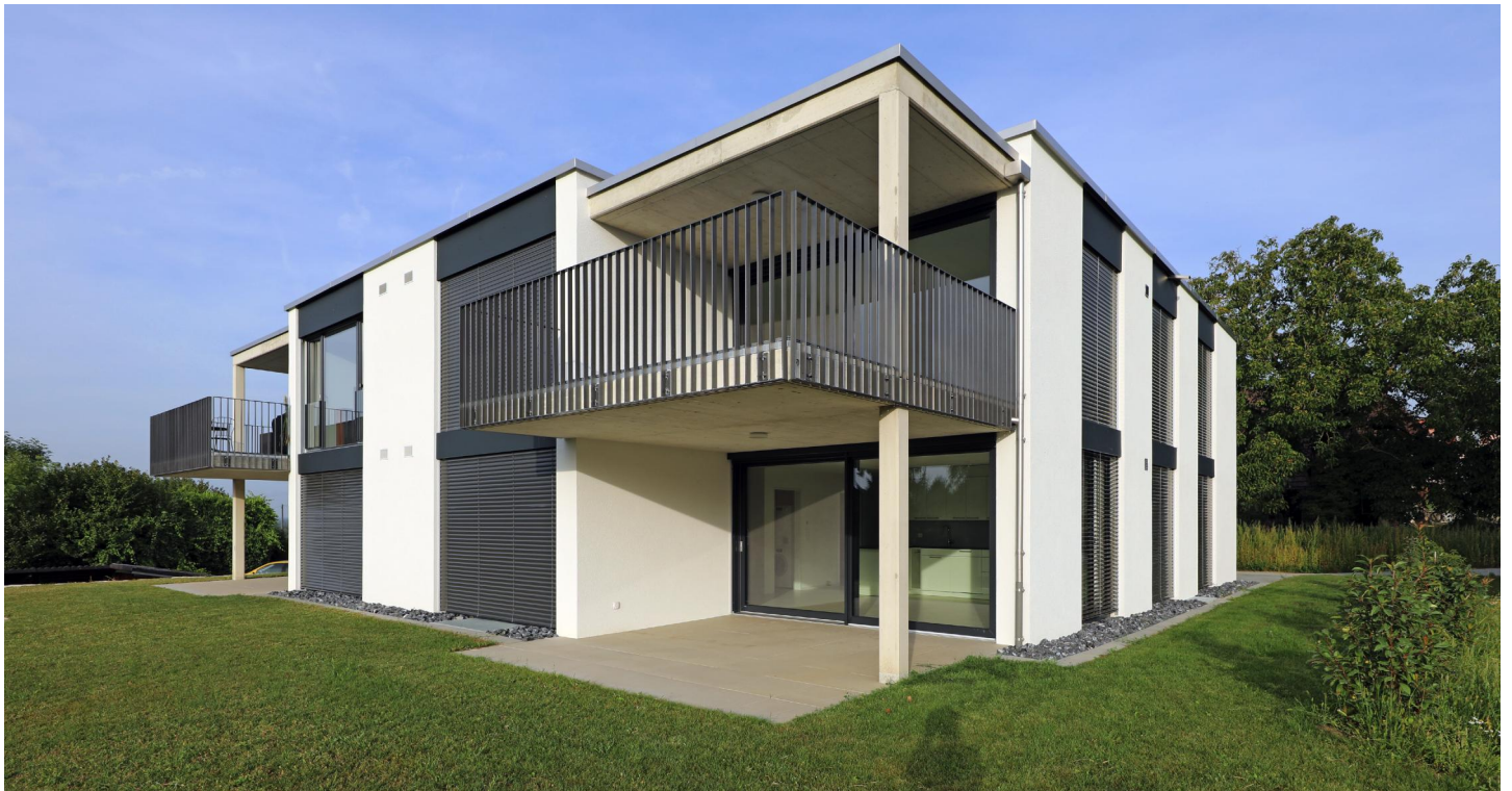
Ansicht von Südosten