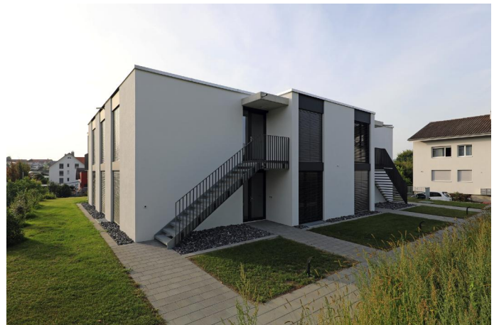
Direkter Aussenzugang für jede Wohnung