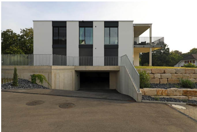
Offene Einfahrt in die Einstellhalle